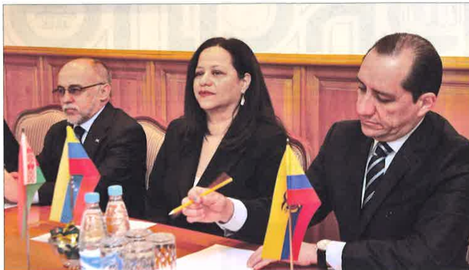
(слева направо) Чрезвычайный и Полномочный Посол Кубы Херардо Суарес Альварес, Временный поверенный в делах Боливарианской Республики Венесуэла Мария Антония Кабеса, Чрезвычайный и Полномочный Посол Эквадора Карлос Ларреа Давила