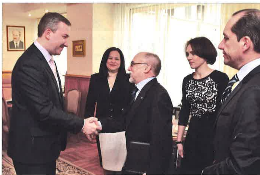
В ходе встречи с ректором Академии управления

Представители дипломатического корпуса в Республике Беларусь – Чрезвычайный и Полномочный Посол Эквадора Карлос Ларреа Давила, Чрезвычайный и Полномочный Посол Кубы Херардо Суарес Альварес, а также Временный поверенный в делах Боливарианской Республики Венесуэла Мария Антония Кабеса – посетили 26 марта Академию управления при Президенте Республики Беларусь.